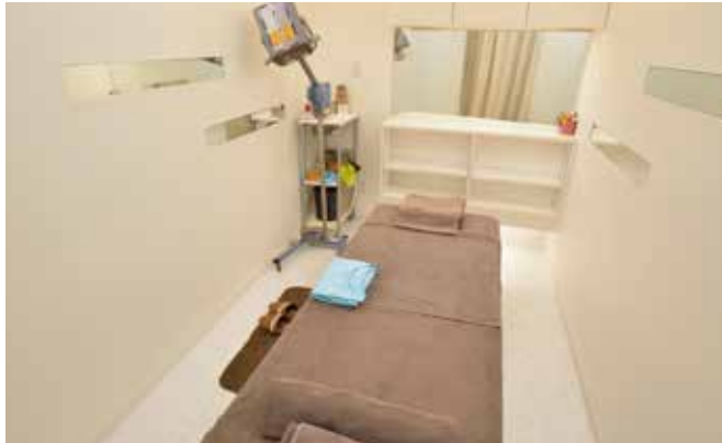
白を基調とした清潔感あふれる施術室。プライバシーが守られていて、リラックスして施術が受けられます。不妊治療の悩みや不安など、メンタル面でのフォローがあるのもうれしい

子宮の血流不良だったり、胃腸の働きが弱くなっている場合は、漢方薬の効果は出にくいのでしょうか？ 「そうですね。十分な効果は期待できません。そのようなたにおすすめのなのが、漢方と鍼灸を併用する方法です。鍼灸は、血流が滞っている部分を、からだの外からピンポイントで治療することができる唯一の方法なのです」 鍼灸は、漢方がスムーズに体に吸収され、よりよく効くためのベースづくりをしてくれる、と西野先生は話します。 「例えば、からだのある部分が充血しているような場合、血流がそこで詰まってしまっ、それより下に流れていきにく