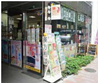
百貨店やブランドショップが立ち並び中央通りからもすぐの立地。1階は漢方薬店、B1が鍼灸の施術室です

たり、子宮や卵巣に行く血流が少なくなるのは事実。時間が限られているなかで、もっとも有効な方法で治療を受けることが大事になります。 「私たちのところで鍼灸と漢方の治療を受けた方が、妊娠されるまでの目安は半年です。これは、私たちがそれぞれの方に合った鍼灸を施術し、年齢によって弱まった妊娠する力を漢方で補いながら治療を進めている証です。アラサーからの妊活を考えていらっしゃるかたは、ぜひ一度ご相談ください」