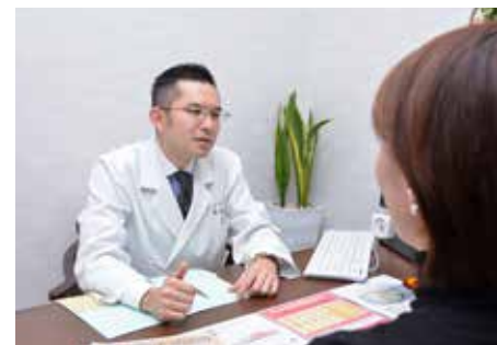
上:漢方はそれぞれの体質にあわせてオーダーメイドで処方してくれる 下:相談は個室で行うので、安心して相談できる