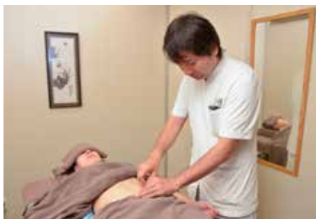
上:銀座店でも漢方を併設 下:お腹の状態を見ながら鍼灸で全身のバランスを整えていく