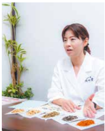
相談後、症状にあった漢方薬の効果や摂取方法についてわかりやすく説明します。