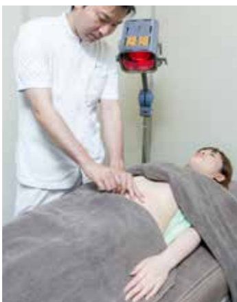
施術は、遠赤外線を体で温めながら行います。下腹部への鍼で子宮や卵巣などへの血流を調整します。

期「黄体期」の4つに分け、周期によってホルモンの状態が変わるので、それぞれに合わせた漢方薬を処方します。また、一人一人の体質や体調にも配慮します。 二つ目の三焦調整法とは、鍼灸による治療です。「三焦」とは、頭からみぞおちまでの「上焦」、みぞおちからへそまでの「中焦」、へそから足先までの「下焦」による3区分で、これらの血流バランスを整える方法が三焦調整法です。 現代の日本人は、頭を使うことが多いので頭部に血流がたより、子宮や卵巣に栄養が運んだり、ホルモンを届けたりする血流が不足しがち。このことが現代女性の不妊と大きくかかわっていると考えています。そこで三焦調整法で全体