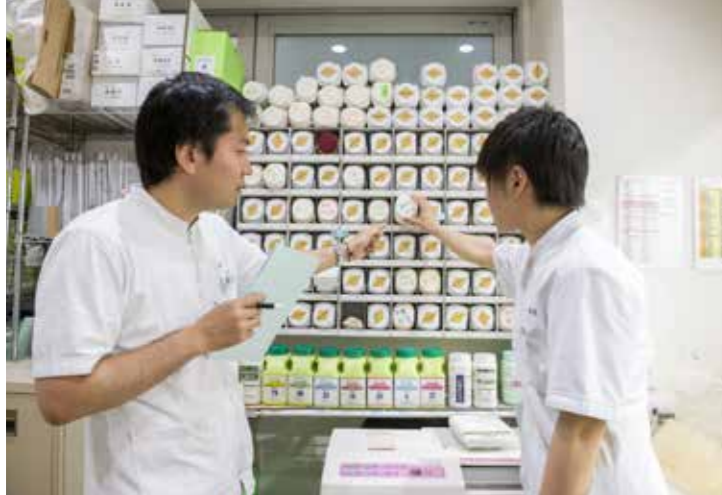
カルテを見ながら、1人1人の症状に合わせて、漢方薬をお選びします。