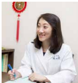
現在の症状や気になる点などを確認しながら、体の状態を診断します。多くの経絡が連絡している舌を診る「舌診」で内臓の状態もわかります。

当院独自の治療法には、①周期調節法 ②三焦調整法 ③補腎の3つの柱があります。一つ目の周期調節法とは、女性の生理の周期を「月経期」「排卵期」「排