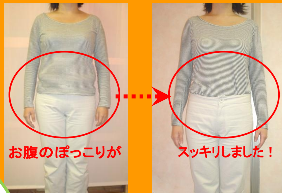
お腹のぽっこりが

夕食は「緑爽美仁」だけなのに、 貧血や冷え、もともと弱かった消化器系の調子もよかったです ですね。過食気味でしたので、食生活を見直す良いきっかけにもなりました。ウエストが10cmも減ったのはビックリ！洋服もかなりゆるくなりました。食費が浮いた分洋服を買っています(笑)