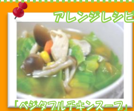
「ベジタブル手毬スープ」