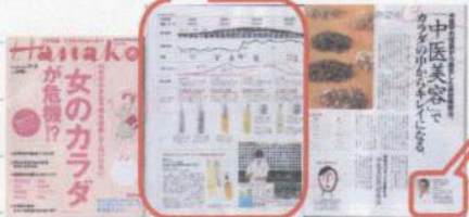
Hanako 11/9 号

http://www.comfortbrook.jp/column/beauty/index.html